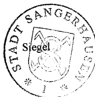
R. Poschmann Oberbürgermeister

Anträge nach § 47 Verwaltungsgerichtsordnung sind unzulässig, soweit mit ihnen Einwendungen geltend gemacht werden, die vom Antragsteller im Rahmen der Auslegung nicht oder verspätet geltend gemacht wurden, aber hätten geltend gemacht werden können. Die Lage des Geltungsbereiches ist aus der Übersichtskarte ersichtlich.