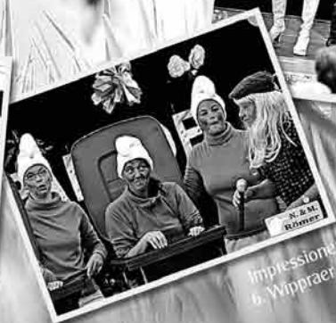
Impressionen von der 7. Wippraer Starparade